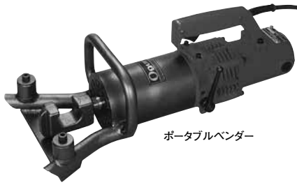
ポータブルベンダー