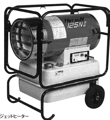
ジェットヒーター