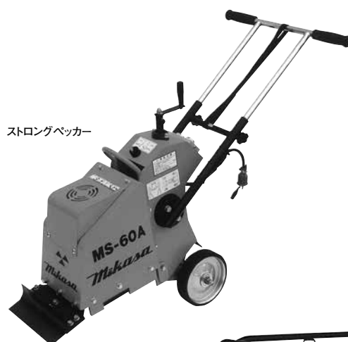
ストロングベッカー