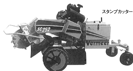
スタンプカッター