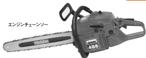
エンジンチェーンソー