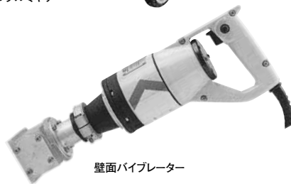
壁面バイブレーター