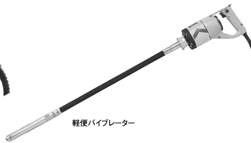
軽便バイブレーター