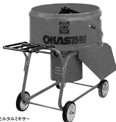
モルタルミキサー